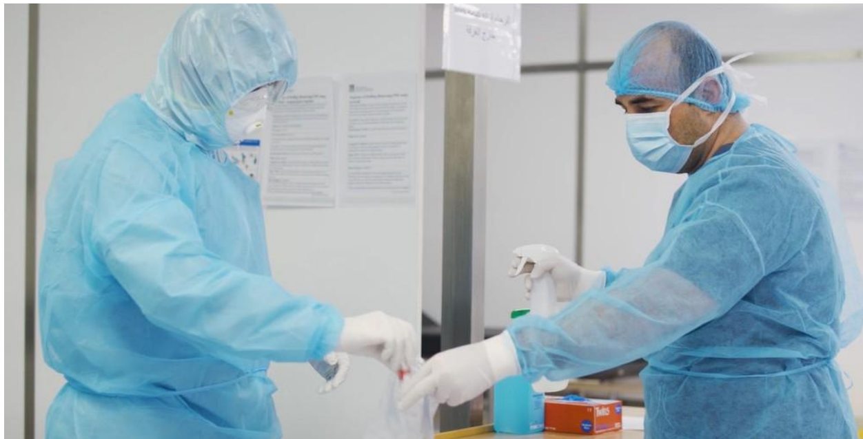
黎巴嫩一家医护中心的前线工作人员。